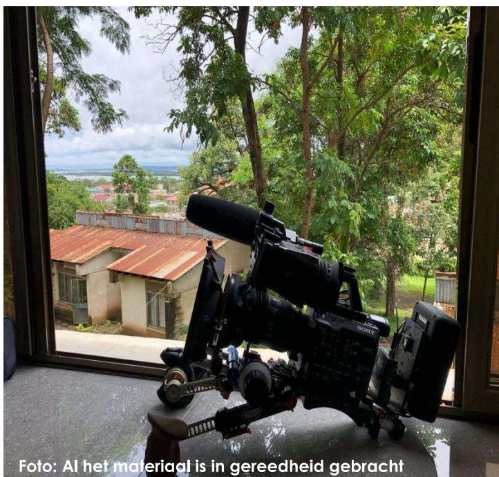
Foto: Al het materiaal is in gereedheid gebracht

Tijdens de verschillende draaidagen zijn wij veel te weten gekomen over de status van de verschillende projecten en hebben wij veel kinderen weer even persoonlijk kunnen spreken. Hoewel wij een hele avond vol zouden kunnen praten over deze bijzondere reis, hebben wij hier een selectie moeten maken. Graag willen wij deze verhalen hier met jullie delen.