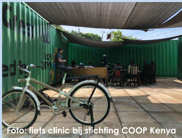
Foto: fiets clinic bij stichting COOP Kenya

Tijdens ons verblijf in Kenia woonden wij een fietsclinic van Stichting COOP bij. Tijdens deze workshops leren de kinderen zelf hun fiets te onderhouden en te repareren, zodat zij langer plezier hebben van de fietsen.